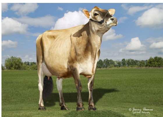
PROGENESIS BNCROFT DEJA