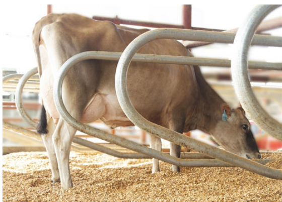
PROGENESIS BNCROFT DEJA